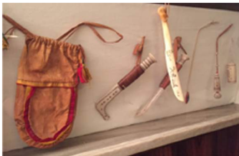
2. Väska, knivar, halssmycke och nålhus.