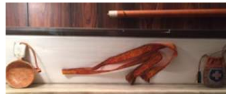
3. Kåsa, slips och saltpåse. Vandringsstav ovanför.